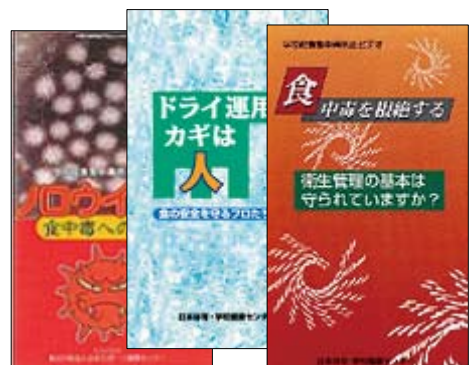
「食中毒防止ビデオシリーズ」

※ 上記を含めて衛生管理に関する資料は、発行元のホームページから無償でダウンロードできます。