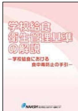
「学校給食衛生管理基準の解説 —学校給食における 食中毒防止の手引—」 (平成23年3月発行)

※平成19年度以前は「学校給食衛生管 推進指導者派遣・巡回指導報告書」と して発行