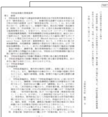
「学校給食衛生管理基準」 (平成21年4月1日施行)