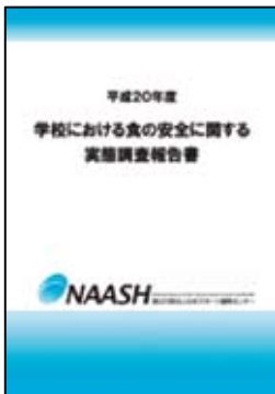
「学校における食の安全に関する 実態調査報告書」 (平成14年度～/毎年度発行)

※平成19年度以前は「学校給食衛生管 推進指導者派遣・巡回指導報告書」と して発行