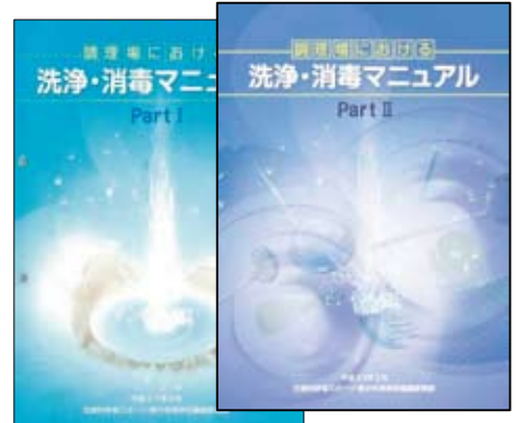
「調理場における 洗浄・消毒マニュアル Part I」 (平成21年3月発行) 「調理場における 洗浄・消毒マニュアル Part II」 (平成22年3月発行)