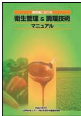
「調理場における 衛生管理&調理技術マニュアル」 (平成23年3月発行)