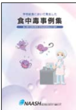
「学校給食において発生した 食中毒事例集」 (平成22年3月発行)